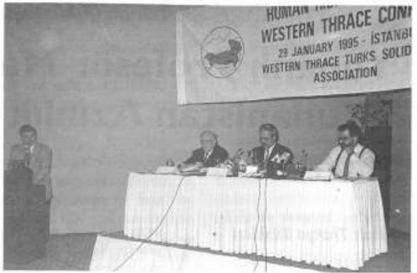
Batı Trakya Türkleri Dayanışma Derneği Genel Merkezi tarafından düzenlenen uluslararası panel büyük ilgi gördü.

varlığını inkar eden Rumlara, binlerce Batı Trakya Türkü'nün 1988 yılında dağları nehirleri aşarak Gümilcine'de toplanarak varlıklarını bir kez daha ispatladıklarını vurguladı.