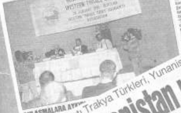
ANLAŞMALARLA AYRILAN BATI TRAKYA TÜRKLERİ, YUNANİSTAN'I AZINLIK HAKLARINA SAYGILI OLMAYA ÇAĞIRDI