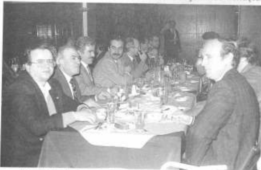
Batı Trakyalılar, Batı Trakya Derneği'nin verdiği iftar yemeğinde biraraya geldiler.