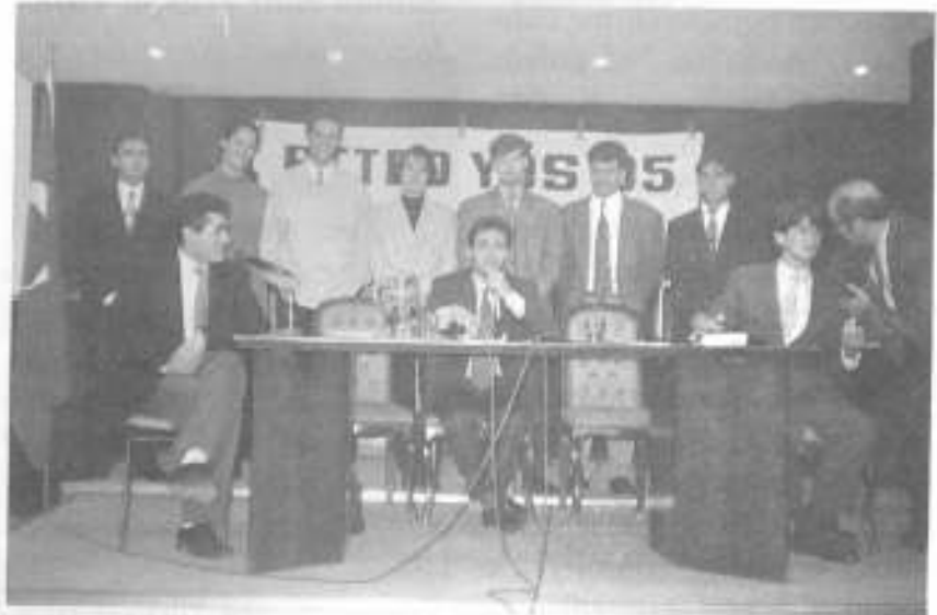
Zeytinburnu Şubesi nin düzenlediği "YÖS Paneli" nde, Batı Trakyalı öğrencilerin eğitim meseleleri ele alındı.