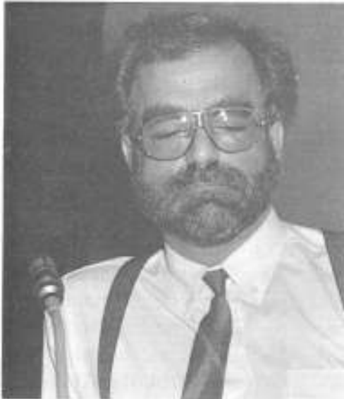
Panelde Kıbrıs'tan katılan Doğu Akdeniz Üniversitesi Öğretim üyesi Megalomatis, Yunanistan'ın Müslüman Türk kimliğini inkar etmeğe çalıştığını söyledi.