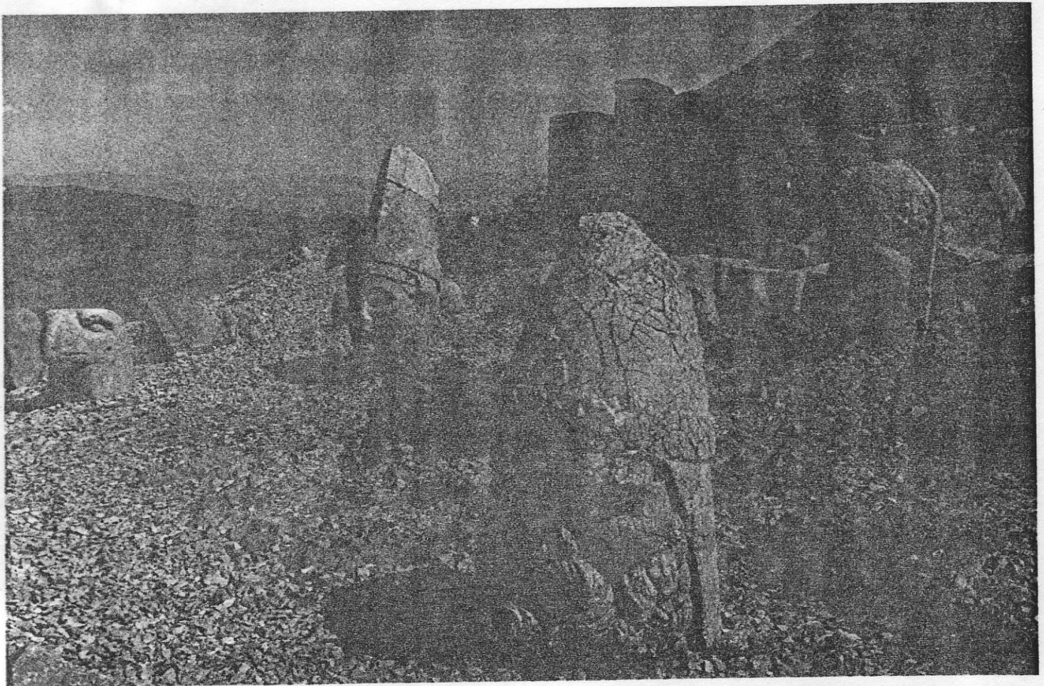
Το κεφάλι αγάλματος του Απόλλωνα-Μίθρα-Ερμή-Ήλιου, αριστερά, καθώς και τα κεφάλια αγαλμάτων του Δία-Ωρομάζδη, στο κέντρο, και της Τύχης-Κομμαγηνής, δεξιά. Στο βάθος υπάρχουν ανάγλυφα με ελληνικές επιγραφές. Η δυτική

εξέδρα του Ιεροθέσιου κορυφής του Νέμρουτ-Νταγ ανεγερμένου από τον Αντίοχο Α΄ Κομμαγηνής, 62 π.Χ. (νοτιοανατολική Τουρκία).