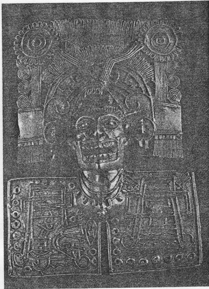
Ο Μικτλαντεκουτλί, θεός του θανάτου. Χρυσό εγκόλπιο, 8ος - 11ος αι. μ.Χ. (Oaxaca Μεξικού, State Regional Museum of Archaeology).

Μικτλαντεκουτλί (Mictlantecutli) ή Mictlantecuhli ). Θεός του θανάτου, του σκότους και του Κάτω κόσμου του πανθέου των Αζτέκων. Το όνομά του σημαίνει τον άρχοντα του Μικτλάν, δηλ. της χώρας των νεκρών, όπου καταλήγουν όσοι δεν πεθαίνουν κατά ιερό τρόπο, όπως ο άνδρας στον πόλεμο, η γυναίκα στην εγκυμοσύνη ή στη γέννα, ή τα θύματα του θεού Τλαλόκ* και των ιεροτελεστιών ανθρωποθυσίας. Σχετικά πιστευόταν ότι εκεί ο νεκρός