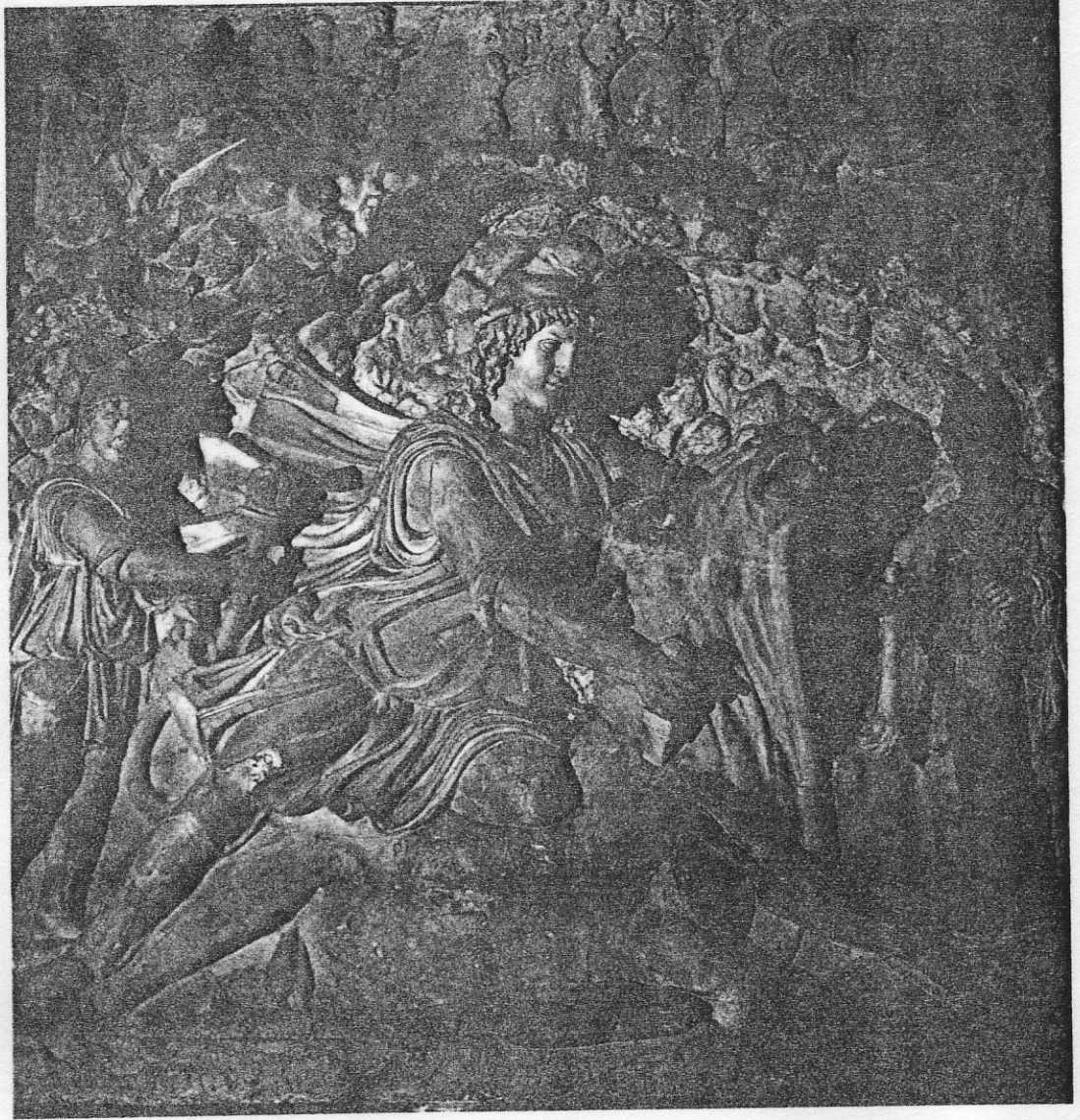
Ο Μίθρας εξοντώνει τον ταύρο μέσα στο σπήλαιο. Αριστερά ο Καύτης και δεξιά ο Καυτοπάτης. Μνημειώδες ανάγλυφο (2,54 x 2,75 μ.) ρωμαϊκού Μιθραίου, τέλος 3ου αι. μ.Χ. (Παρίσι, Λούβρο).

Η ανάπτυξη της μιθραϊκής θεματολογίας φτάνει έτσι σε ολοκληρωμένο επίπεδο μυθολογίας, όπου ο Μίθρας είναι βέβαια ταυροκτόνος, όμως περισσότερο συμβολικά, αφού τώρα ο κύων , ο όφις και ο σκορπιός συμμετέχουν ενεργά στο πλευρό του Μίθρα κατά του ταύρου. Καθώς αυτό το θέμα παύει να είναι το μόνο ή τουλάχιστον το κύριο, όπως ήταν παλαιότερα, χάνει τη σημασία του. Έτσι, όταν στην κεντρική αψίδα των δυτικών Μιθραίων υπάρχει το