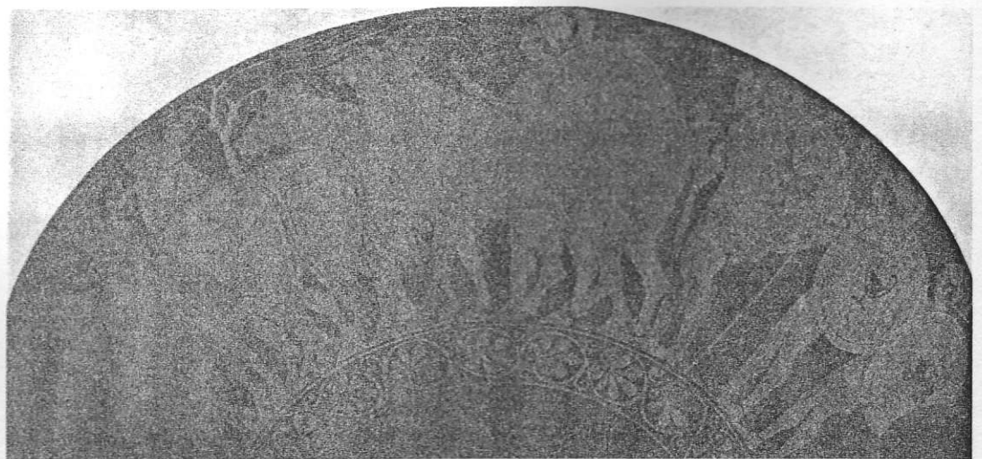
Ο Νηλέας και οι γιοι του συνοδεύουν πέντε αγελάδες και έναν ταύρο, που έκλεψαν από τον Ηρακλή ενώ επέστρεφε με το κοπάδι του Γηρύονη στην Ελλάδα. Ερυθρόμορφη κύλικα, περ. 510 π.Χ. (Μόναχο, Staatliche Antikensammlungen).

ναι η ύβρις της Νιόβης, που, αφού απόκτησε πολλά και όμορφα παιδιά, καυχήθηκε ότι ήταν πῆς Λητούς* εὐτεκνοτέρα . Γι' αυτό τα παιδιά της Λητός, ο Απόλλων* και η Ἄρτε-